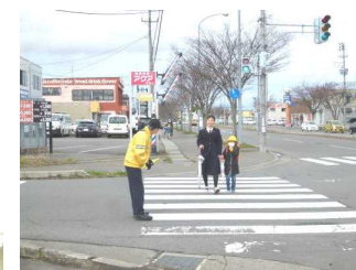
古館町会交通安全見守り隊の方々が、さっそく登校指導してくれました