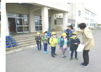
1年生には下校指導をしました