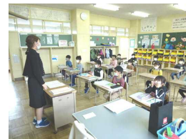
担任の先生と学校の約束事を確認したり、次回の登校日の説明を聞いたりしました。1年生は少し緊張ぎみでした。