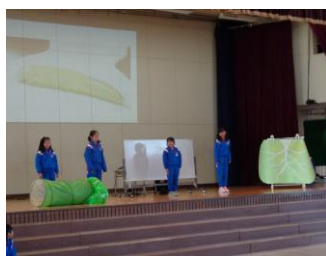
3年 モンシロチョウ観察日記