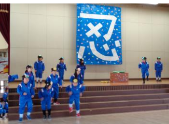
2年 甲田忍者小学校