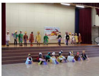
1年 十二支のはじまり

※以下の写真は、20日(木)に行われた発表会予行での様子です。発表会当日の写真は、近日まちこみメールで若干数を配信します。