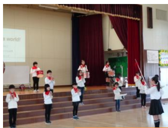
5年 It's Kouda world