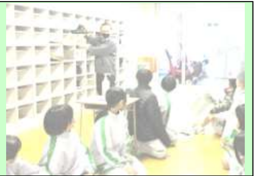
保健委員会の皆さん

保健委員会の皆さんが、各学年ごとに下足箱に段ボール紙を敷いてくれました！！しかも、全員の分！雪国の冬支度、バッチリですね。各学年でやってくれた皆さんに、直接言葉で伝えたいですね。「 私の下足箱にも敷いてくれて、どうもありがとう！ 」 こういう見えないところででもだれかのために頑張っている姿、ステキですね。