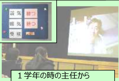
1学年の時の主任から

「今日は僕たちのために、このような会を開いてくれて、本当にありがとうございました。中学校に入学してから、今日までの楽しかった思い出を振り返っておもしろかったです。どれだけたくさんの人に応援されているのが強く実感しました。」 (3の2男子)