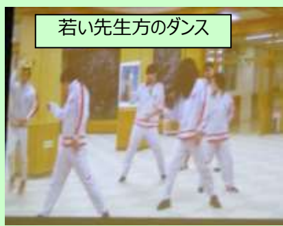
若い先生方のダンス