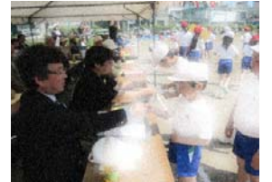
賞状をもらった笑顔