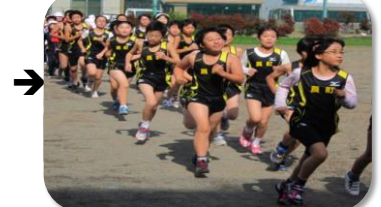
新しいユニホームでうれしそうに走る6年生