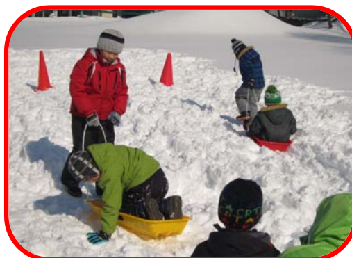
校庭での雪上運動会から(1・2・3年)