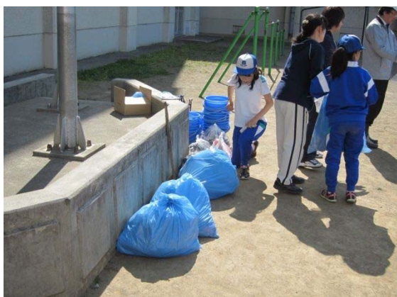
こんなにごみが集まりました