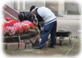
ブロックもしっかりと積み直し。