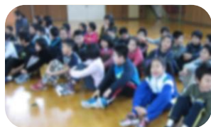
みんな楽しそうですね。