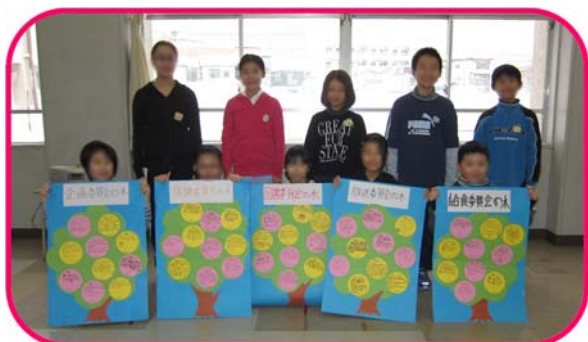
『委員会の木』を引き継いだ新委員長の面々(後列は旧委員長)

2月26日、委員会活動役員引継ぎ式がありました。今年度の現委員長(6年生)から来年度の新委員長(5年生)に『委員会の木』が手渡されました。6年生の「あとをお願いします」という気持ちと5年生の「今度は私たちの出番だ」という気持ちが緊張感とともにひひしと伝わってきました。6年生の皆さんお疲れさまでした。そして、ありがとう!5年生の皆さん、今度は皆さんの出番です。よろしくお願いします。