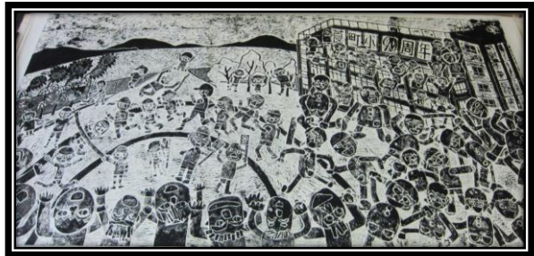
題名：「ぼくたち・わたしたちの葛町小学校」