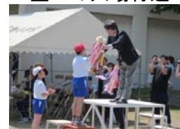
優勝杯授与 <終わりに>