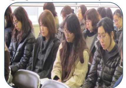
熱心にお話を聞くPTA会員