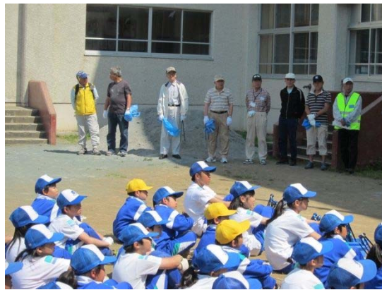
ご協力してくださった“地域の皆さん”や“保護者の皆さん”