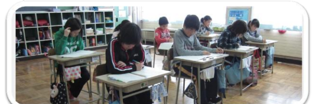
最上級生になる準備、熱心にテスト問題を解く5年生

子どもたちは、今年度学習したことを思い出しながら、熱心にテストに取り組んでいました。わからなかった問題はもう一度復習して、しっかりとわかってから進級できるように指導していきます。