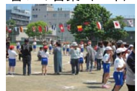
親子一緒にダンス