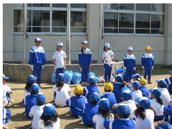
活動後の感想発表(各学年の代表)