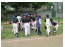
四校親善野球大会