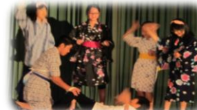
6年 劇 ユタとふしぎな仲間たち