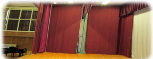
学習発表会で早速、活躍してくれました。

学習発表会に間に合わせて体育館ステージの協幕が新しくなりました。今年度の卒業記念品として6年生の保護者から贈呈して頂きました。末永く、大切に使用させて頂きます。ありがとうございました。