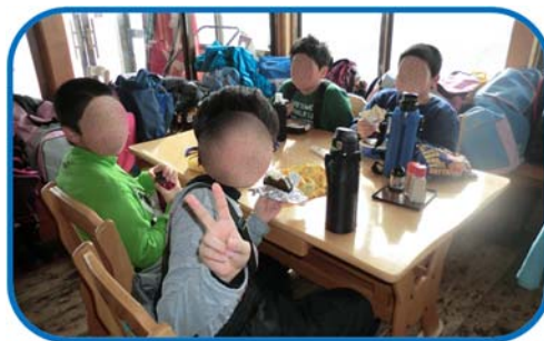
モヤヒルズでのスキー教室から(4・5・6年)

2月6日(水)4・5・6年がモヤヒルズにスキー教室に出かけました。前日の大荒れな天気で実施できるかどうか心配しましたが、当日は好天に恵まれ、予定通りに日程を消化しました。また、14日(木)は、これも好天の下、1・2・3年の雪上運動会が行われました。どの学年もスキー学習を楽しみ、雪との親近感を増すことができました。