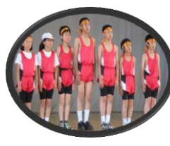
従来のユニホーム

御協力頂きました町会長さんをはじめとする教育振興会特別会員の皆様、そして、バザーに御協力頂いたPTA会員の皆様に心から御礼申し上げます。