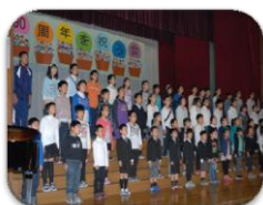
みんなで呼びかけ

学習発表会に先立ち行われた創立90周年を祝う会は子どもたち、教職員が心からおめでとうの気持ちを込めて行いました。映像による学校の歴史紹介、共同版画の除幕、全校合唱が子どもたちの呼びかけとともに進行了ました。