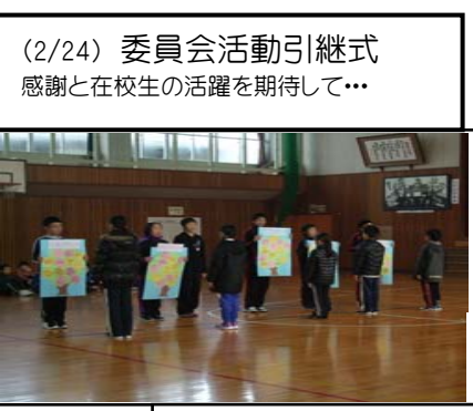
(2/24) 委員会活動引継式 感謝と在校生の活躍を期待して...