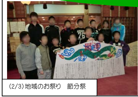
(2/3) 地域のお祭り 節分祭

気がゆるみがちな学年末学年始休業中においても子どもたちが安全に過ごし、希望をもって進学、進級ができるよう、皆様の温かな声掛けをお願いいたします。