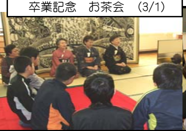
卒業記念 お茶会 (3/1)