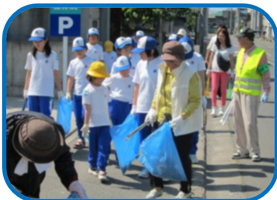
みんなで力を合わせて！