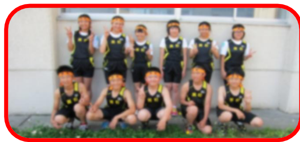
新調したユニホームを着て張り切る選手たち

本校は、6年生8名と男子リレーの助っ人2名(5年生)が出場しました。練習の成果を十分に発揮してくれました。選手の皆さん、ご苦労様でした。