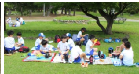
みんなで お弁当 いただきます