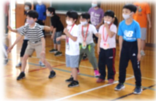
↑「だるまさん転んだ」を楽しむ1年生

当日は、2～6年生全員で、1年生が入場する花道を作り、1年生3人を見守りました。その向けられたまなざしの優しいこと。「待っていたよ」、「もっと仲良くしようね」、「遅くなったけど仲間だよ」そんな声が聞こえてきそうでした。1年生が自己紹介すると、自然に大きな拍手が起こりました。全校ゲーム「だるまさんが転んだ」では、丸尾先生や校長先生が鬼になり、大いに盛り上がりました。交流できない期間があった分、全校で集う嬉しさと楽しさを実感し、新しい仲間を愛しく思う気持ちがより強くなった気がしました。