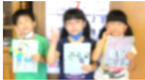
↑1年生3人、ものすごく成長しました！

それではみなさん、明日から待ちに待った夏休みです。お家で食育チャレンジプログラムは、規則正しい生活や食べ方、運動に気をつけて過ごすんだね。早寝・早起きをして、朝ごはんをしっかりと食べて、夏休みにしかできないことにたくさんチャレンジしてください。そして、交通事故・不審者・熱中症・コロナウイルス感染症などに気をつけて、元気な姿で8月24日に会いましょう。