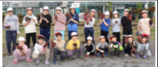
もらう順番は、ジェンカをしながらのじゃんけん列車で決め、20名の児童に持たせることができました。

5月末に植えたサツマイモを、10月18日(水)に全校で収穫しました。品種「パープルスイートロード」は不作でしたが、品種「べにはるか」は大豊作で、子どもたちは特大サツマイモに驚き、歓声をあげながら収穫していました。収穫後は約4週間陰干しをし、甘みを凝縮した後、11月13日(月)に、子どもたちに配付しましたので、ご家庭でご賞味いただいたことと思います。