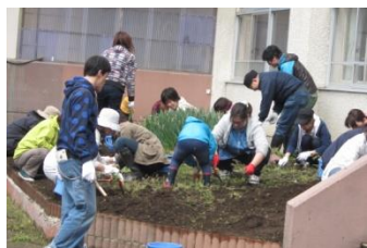
みんなで雑草取り

5月18日（日）、運動会を翌週に控え、PTA恒例の花壇整備と校庭整地が総勢60名程の保護者、卒業生、本校児童が集合し、協力して作業に取り組みました。花壇の土おこし、雑草取り、花植え等、花壇担当の人たちが手際よく、作業を進め、あっという間に花壇作業が終了、一方、校庭では、石拾い、雑草取りが行われ、運動会が始められる状態になりました。休日の午前中に、こんなに大勢の人が集まってくださる学校ってすばらしい、この団結力が本校を支えてくださっていると感じた一日でした。ご協力ありがとうございました。