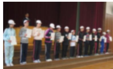
チーム推進役の6年生