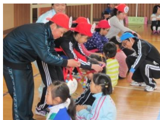
6年生からのプレゼント