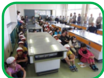
真剣に話を聞く子どもたち

これからも、「自分の命は自分で守る。」「みんなで協力して、葭小の子どもたちの命を守ろう。」ということを再確認できた一日でした。参加して下さった地域の皆様、保護者の皆様、本当にありがとうございました。