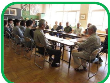
ご参加いただいた皆様