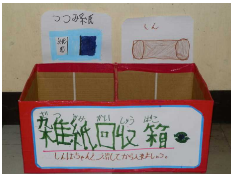
【トイレ前廊下に設置した雑紙回収箱】

苺小学区を4コース（栄町公園・堤公園・青柳・青柳公園）に分け、約1時間地域のごみ拾いを行いました。校庭の戻ってきた子どもたちは、ごみの分別や環境の保護に関心を持ち、活動を終えることができました。地域クリーン作戦が現在、トイレトペーパーの芯と包み紙等を捨てないで回収する活動（保健委員会が中心となっている）へとつながっています。