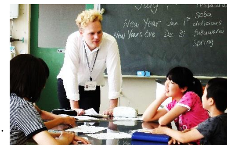
5・6年生の外国語活動の授業から

菫町小学校では、今年度から、3・4年生で外国語活動を週1時間、5・6年生で週2時間行い、32年度に備えています。また、市の国際交流員を活用し、週1時間程度ですが生の英語に触れる機会を設けています。