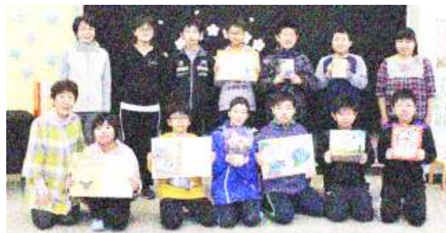
図書ボランティアのみなさんと

さて、卒業を前にして、6年生に今の思いを一字で表してもらいました。それぞれの思いのそれぞれの春がもうすぐやって来ます。